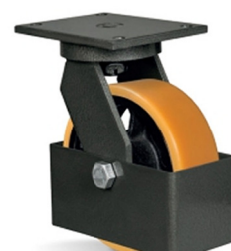
GC - Guarda Corpo