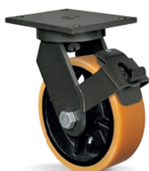
FPR - Freio Pedal