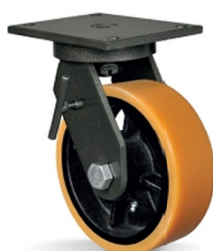
FL - Freio Lateral