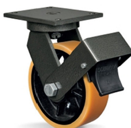
FP - Freio Pedal