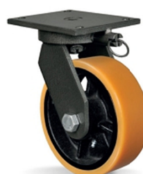
BG - Bloqueio de Giro