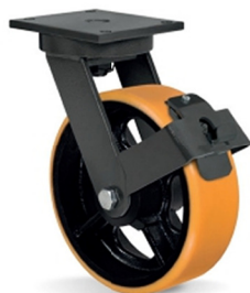
FPR - Freio Pedal