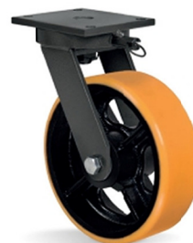
BG - Bloqueio de Giro