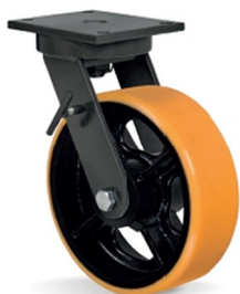
FL - Freio Lateral