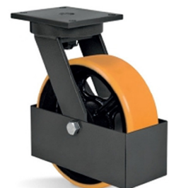
GC - Guarda Corpo