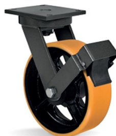
FP - Freio Pedal